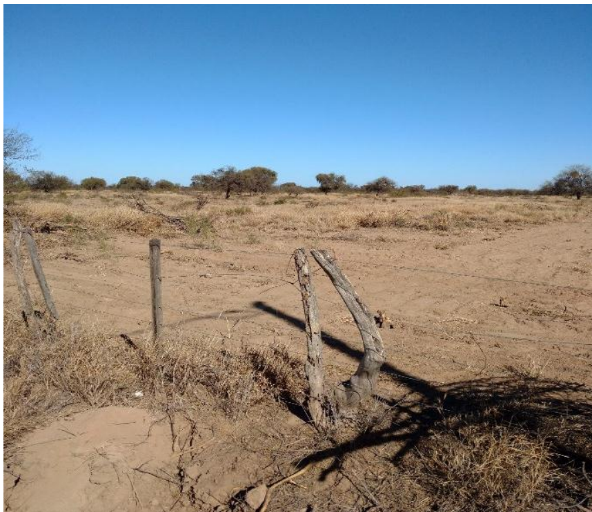
Figura 6: Vista predio desmontado sector este