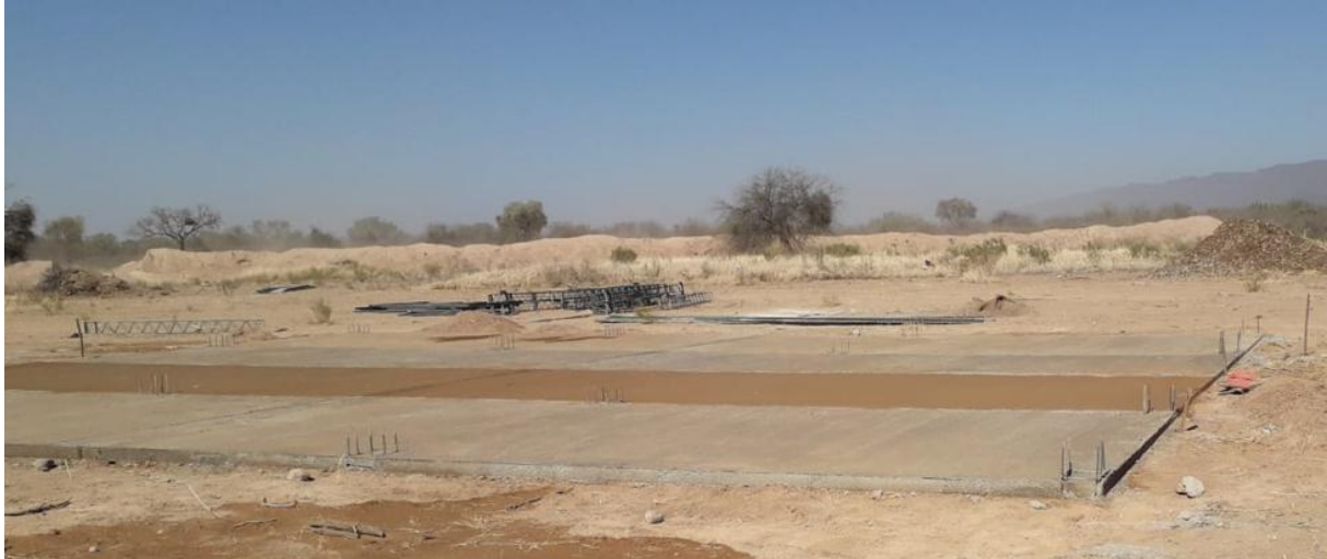
Figura 9: Contrapiso Tinglado