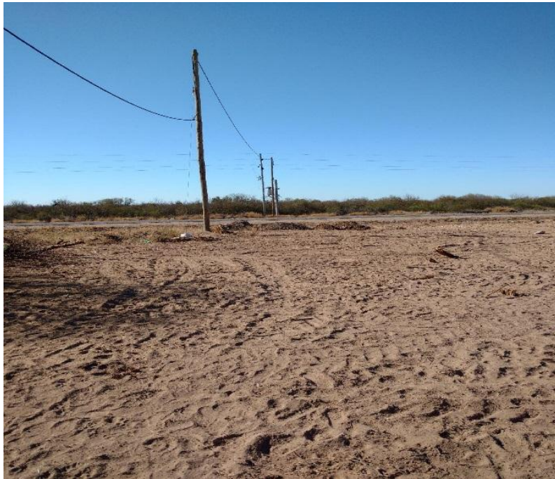
Figura 7: Cruce ruta RN 79 la línea eléctrica desde transformador