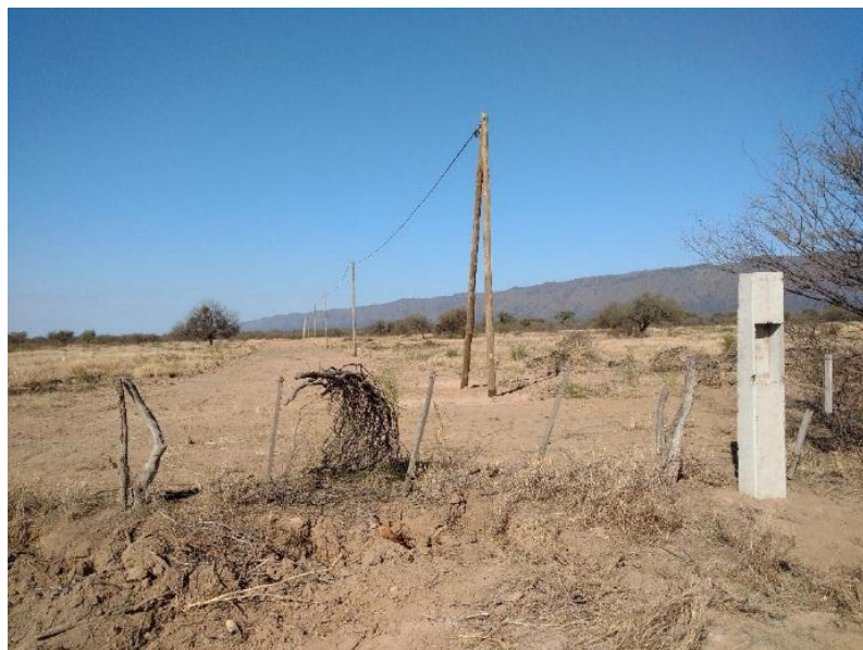
Figura 8: Línea eléctrica dentro predio hasta el ingreso sector RSU

En el mismo predio se procesará la poda urbana por chipeado y se realizará el compostaje conjunto con la fracción vegetal que se separe del RSU. También funcionará en el lugar un vivero municipal.