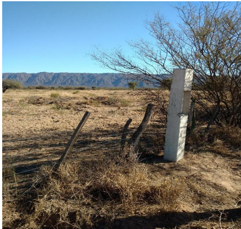
Figura 4: Vista predio desmontado sector oeste