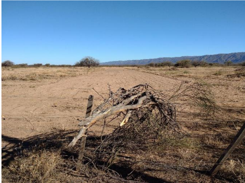
Figura 5: Vista traza vial interna hasta ingreso sector RSU