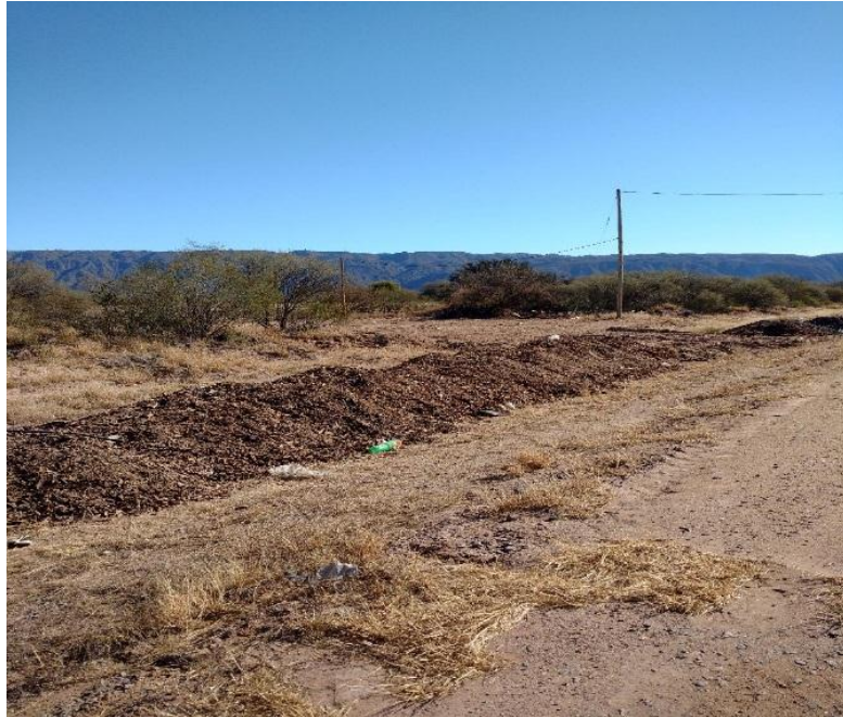
Figura 3: Trabajos acondicionamiento acceso predio desde RN 79

Este terreno ya ha sido dotado de acceso y servicios, ha sido desmontado y cercado, Figuras: 3 a 8.