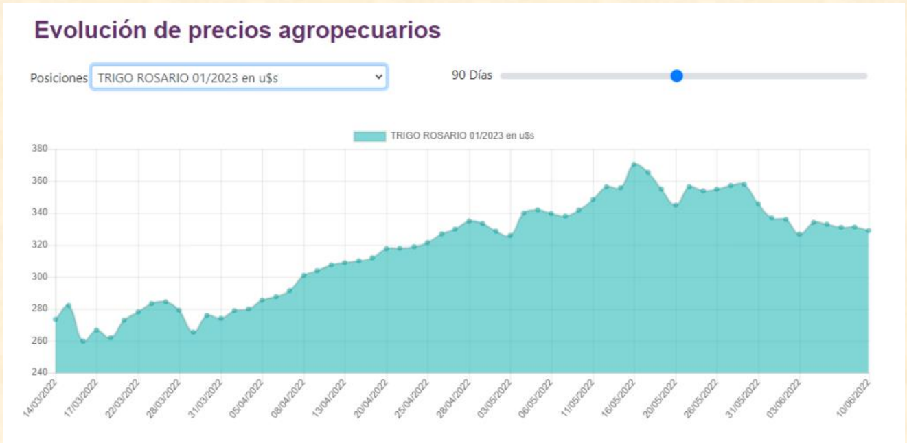
Figura N° 1: Evolución de la posición Trigo enero 2023 en el MATBA ROFEX durante mayo 2022