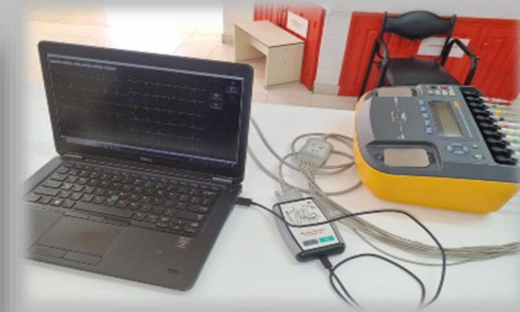
Figura: Equipo ECG y simulador de paciente

Las mediciones se llevarán a cabo con analizador de Electrocardiógrafos FLUKE BIOMEDICAL, e instrumental específico disponible en los laboratorios de Electrónica y de Bioelectrónica de la UTN.