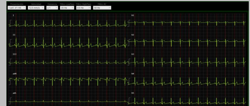
Figura: Sistema de visualización de señal del ECG por puerto USB

- Se utilizó la Transformada de Wavelets para descomposición y análisis de la señal ECG en sus distintas frecuencias. - Desarrollo software de visualización de los estudios ECG de pacientes, este permite la configuración de Derivación/es a visualizar, velocidad, ganancia y filtros low y high pass.