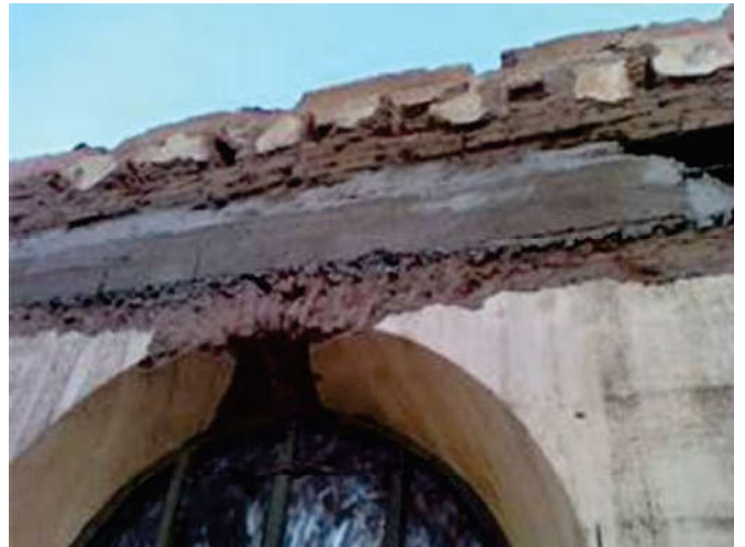
Figura 5. Viga sobre dintel.