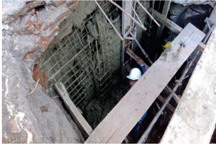
Figura 7. Submuración de paredes de fachadas con gunitado y armadura.