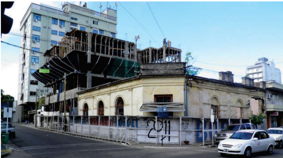
Figura 8. Contrucción de estructura de estabilización en paramentos de fachadas y tareas de submuración.