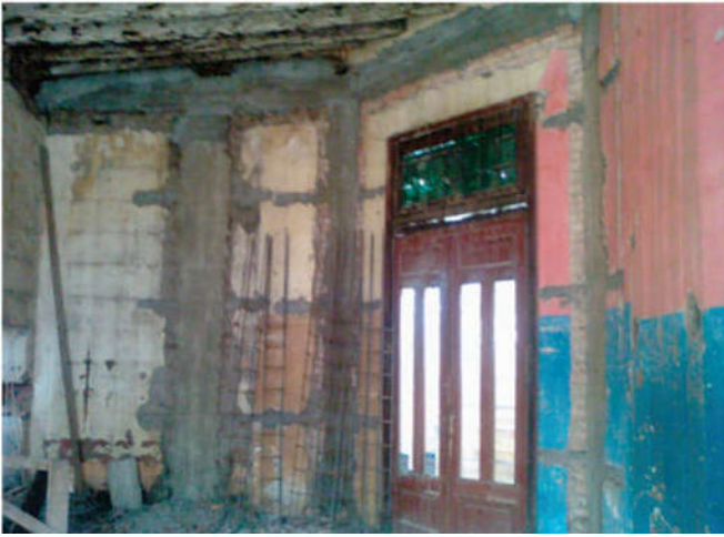
Figura 2. Refuerzo de Hormigon.