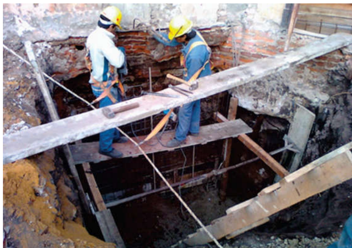
Figura 6. Submuracion de paredes de fachadas con gunitado y armadura.