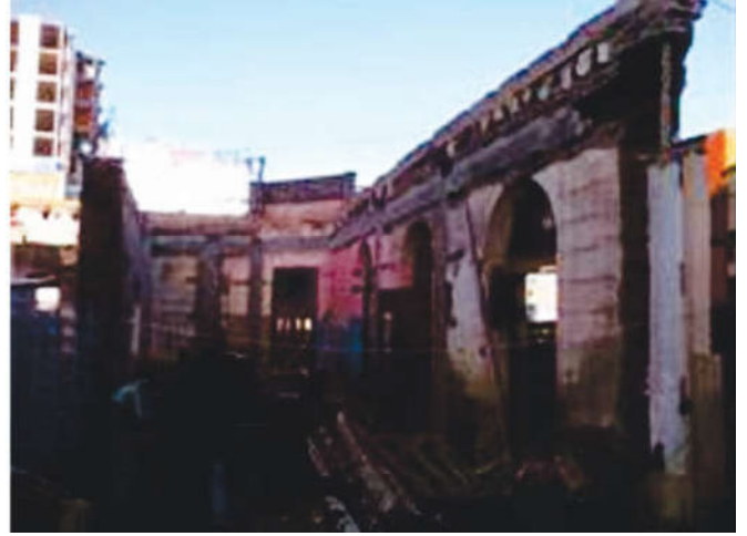
Figura 3. Interior demolido.