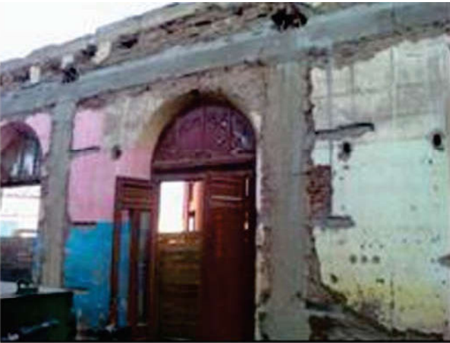
Figura 4. Estructura sobre dintel.