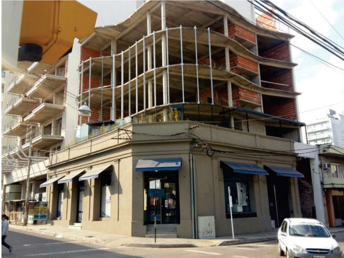
Figura 9. Vista general del nuevo edificio en construcción al fondo y fachada de la Ferretería al frente.

acuerdo a lo recomendado por el Estudio de Suelos realizado. La estructura sobre subsuelo, planta baja y pisos subsiguientes se compone de losas macizas cruzadas, soportadas por vigas de sección rectangular, que descansan en un entramado de columnas de sección cuadrada o rectangular. Las rampas de acceso a cocheras se consolidan mediante un pavimento de 15 cm de espesor.