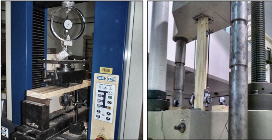
Figura 1. Disposición general de los ensayos estáticos. Izq.: Flexión de plano. Der.: Tracción.

Los ensayos de tracción paralela a las fibras se llevaron a cabo con las tablas de la Muestra Mt, las que fueron ubicadas en la máquina con una longitud libre entre mordazas ( l ) igual a 9 veces su ancho. Se utilizó una máquina de ensayos universales marca Shimadzu de accionamiento hidráulico, con precisión igual al 1 % de la carga aplicada hasta un máximo de 1000 kN. El valor del módulo de elasticidad se determinó adoptando una velocidad constante del cabezal de carga, la cual provocó un desplazamiento menor a 0,00005 l (mm) en la unidad de tiempo (s). Para evitar los efectos de posibles distorsiones, las deformaciones en período elástico fueron registradas con dos comparadores micrométricos de precisión igual a 0,001 mm, colocados sobre los cantos opuestos en un segmento central de longitud igual a 5 veces el ancho de la tabla (Figura 1, Der). Después de esa etapa inicial, los ensayos fueron detenidos y reiniciados con una velocidad constante adecuada para lograr la rotura de la pieza en el tiempo establecido por la norma (300 +/- 120 s). Finalmente se registró la carga máxima, el tiempo empleado en alcanzarla y observaciones relevantes acompañadas de fotografías. La tensión de rotura ( f_{t0} ) y el módulo de elasticidad ( E_{t0} ) se calcularon empleando las ecuaciones provistas por la norma EN 408 (2010).