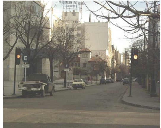
Figura 4 – Ejemplo de semáforo pintado fuera de lo reglamentado

Analicemos algunas de estas en cuanto al cumplimiento de las normas principales enunciadas. La primera que llama la atención en cuanto a su no cumplimiento, siendo que resulta sumamente sencillo de lograrlo, es la de la coloración del semáforo. El establecer franjas de color verde y amarillo evidentemente ha sido producto de establecer un elemento que sea claramente visible, debido a que estos colores se ubican en el centro del espectro visible por el ojo humano (colores cercanos al infrarrojo o el ultravioleta no son fácilmente perceptibles) (Zuccarelli, 2004). Un ejemplo se puede observar en la Figura 4 en donde el color oscuro del poste del semáforo hace que se confunda con los troncos de los árboles cercanos (Rivera, 2009).