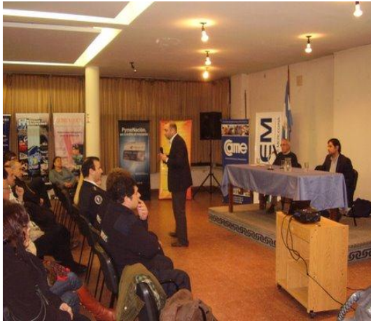
Figura 12 – Capacitación del LEMaC a responsables del área vial