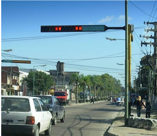
Figura 9 – Ubicación inadecuada de luces en semáforos horizontales

además de presentar unidades ópticas cuadradas, muestra luces dobles, repetidas y en el posicionamiento inverso a lo reglamentado. No se trata de un tema menor, ya que por ejemplo usuarios que sufran de daltonismo, y que se encuentran habilitados para conducir, no tienen manera alguna de distinguir cual es la indicación que están recibiendo (Zuccarelli, 2004).