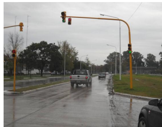
Figura 8 – Semaforización inadecuada de una dársena de giro

Otro ejemplo de mala aplicación de las luces de giro se observa en el semáforo de la Figura 8, que regula el giro a la izquierda de una dársena colocada a la derecha de la vía de circulación (Rivera y Brizuela, 2011). La señal así colocada parecería indicar al conductor que no es un usuario habitual, y que no hubiera percibido la dársena de giro existente a su derecha, que el giro a la izquierda se debe realizar desde el carril izquierdo de circulación, por lo tanto si la flecha se encuentra en rojo frena para esperar la flecha en verde. Esto es un comportamiento de potencial causa de una colisión por alcance de un vehículo que viniera tras éste y que pretendiera seguir su marcha. Tal vez la disposición adecuada hubiera sido un semáforo en particular para la dársena, apuntando directamente a ella y no a los carriles de circulación, complementado con un adecuado señalamiento vertical que indique la operatoria de uso de la dársena a derecha y giro a la izquierda.