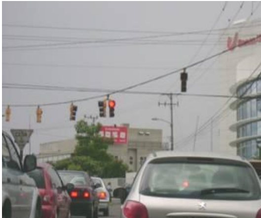
Figura 6 – Soporte de semáforo con rigidez “discutible”

En cuanto al posicionamiento de las unidades ópticas por su color, no se suelen registrar ejemplos en donde no se cumpla con los reglamentado cuando se trata de semáforos dispuestos en forma vertical, aunque caben citar ejemplos de estos semáforos en donde las señales de giro no han sido adecuadamente dispuestas, uno de ellos se da en lo que se observa en la Figura 7.