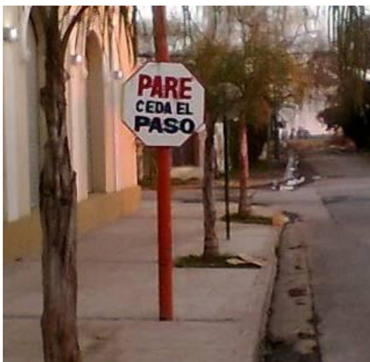
Figura 1 - Señal vertical fuera de norma

Estas aplicaciones han permitido observar a los profesionales del LEMaC intervinientes que muchos de los problemas de inseguridad vial detectados, sino la gran mayoría, serían subsanables o al menos seriamente atenuables si se diera cumplimiento cierto a lo que desde los distintos órganos de gobierno o de aplicación se ha establecido a través de leyes, normas o especificaciones, intentando tanto normar la conducta de los usuarios, aspectos relacionados con los vehículos o características de la infraestructura (Botasso y Rivera, 2008b). Lo citado se hace mucho más evidente, en cuanto a la infraestructura vial refiere, en lo que respecta a elementos tales como señalamiento vertical, demarcación horizontal, semaforización, barandas de contención, etc., es decir elementos que podemos englobar bajo el rótulo de "dispositivos de control de tránsito" (Cal y Mayor y Cárdenas, 2007). Es así como en una red en estudio es común encontrar diversas tipologías para un mismo elemento, lo cual no tendría en principio razón de ser, y que de estas tipologías muchas no guardan relación con los parámetros normados en tal sentido, como puede observarse en la Figura 1.