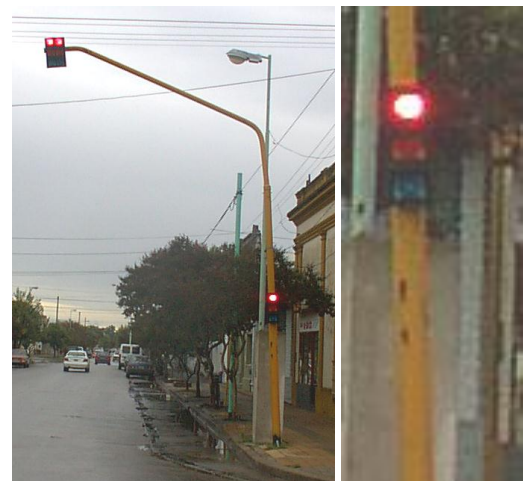
Figura 5 – Semáforo con unidad óptica con forma y dimensiones inadecuadas

Otro de los aspectos que contribuyen a la visibilidad es el tamaño de las unidades ópticas, que como recordamos deben ser redondas. El ejemplo de la Figura 5 nos permite observar una unidad óptica que además de ser cuadrada posee un diámetro sumamente exiguo (Botasso et al, 2004).