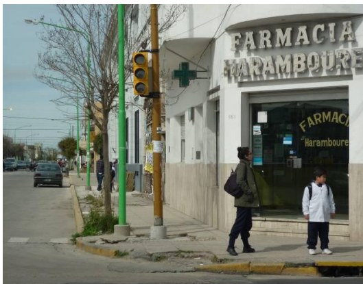
Figura 10 – Poste de semáforo obstaculizando la circulación peatonal

Los citados son ejemplos relacionados con lo directamente expresado en la Ley en cuanto a los semáforos, de todos modos existen además toda una serie de aspectos expresados en la misma que también deben ser atendidos por estos, por ejemplo la no incorporación de obstáculos a la circulación u obstáculos a su visualización, lo cual puede ser incumplido con ejemplos de aplicación como los de la Figura 10 y la Figura 11.