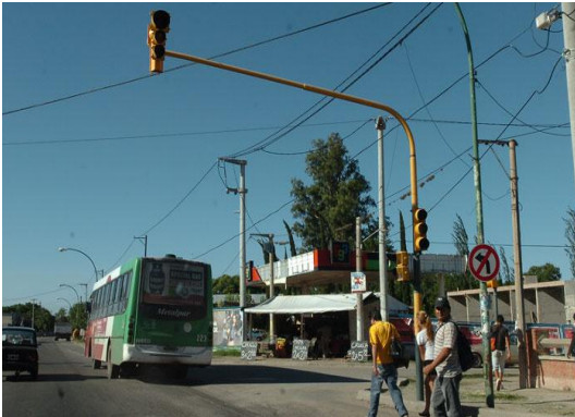
Figura 3 – Elementos semafóricos acorde a lo legislado

Pero si analizamos áreas urbanas específicas descubriremos la existencia de otras tipologías para las cuales cabe la pregunta en cuanto a si ese elemento colocado es considerable un semáforo o no.