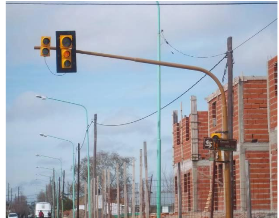
Figura 11 – Señal de semáforo obstaculizada por un nomenclador