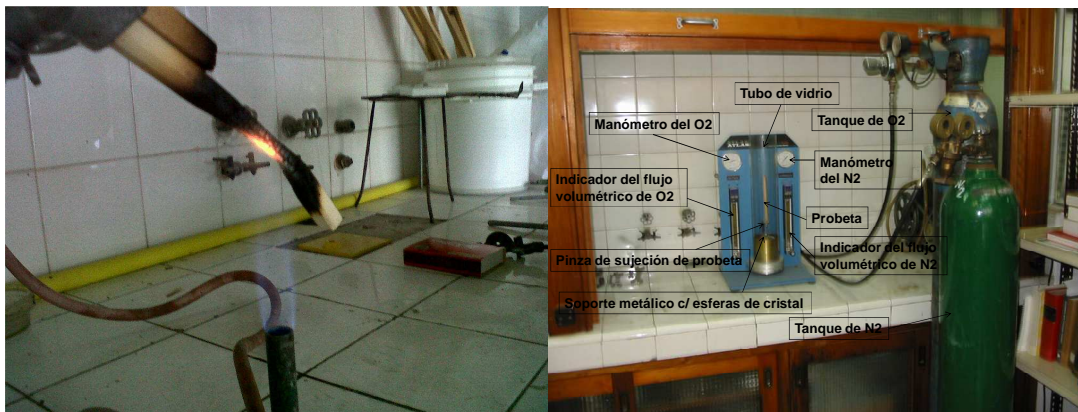
Figura 1. Ensayo Intermitente. Figura 2. Ensayos Índice de Oxígeno (OI).