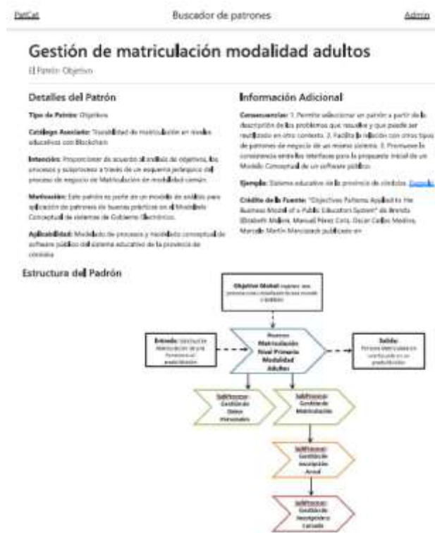
Figura 1. Pantalla de “PatCat”.

2. Definir el caso de uso Blockchain al que aplica el proceso. Se selecciona de la taxonomía (2) Incentivo . Luego se define más específicamente el caso de uso Blockchain, se sugiere tomar como referencia la clasificación del catálogo “Use Cases - Global Blockchain Business Council” [14] y emplear en lo referente a términos de la tecnología Blockchain la ontología Ethon más la extensión para aplicaciones descentralizadas detalla por Besancon et al. [15]. Es relevante tener en cuenta recomendaciones de redacción propuestas por Treiblmaier [16]. Desde la práctica académica, se comprobó que al dividir el proceso en tantos subprocesos como sean necesarios para identificar un solo caso de uso por cada uno de ellos, es un nivel de granularidad que facilita y simplifica su modelado, por lo que se sugiere este desglose en el análisis. Además, en esta instancia se propone un método de selección de patrones de negocio asistido de modo informático, que permita la reutilización de modelos de contratos inteligentes encapsulados en patrones de acuerdo al caso de uso que se aplique [8]. Para ello se construyó un prototipo denominado “PatCat” (Pattern Catalogue). A modo de ejemplo, se presenta en la Figura 1 una pantalla de ejemplo de “PatCat”: